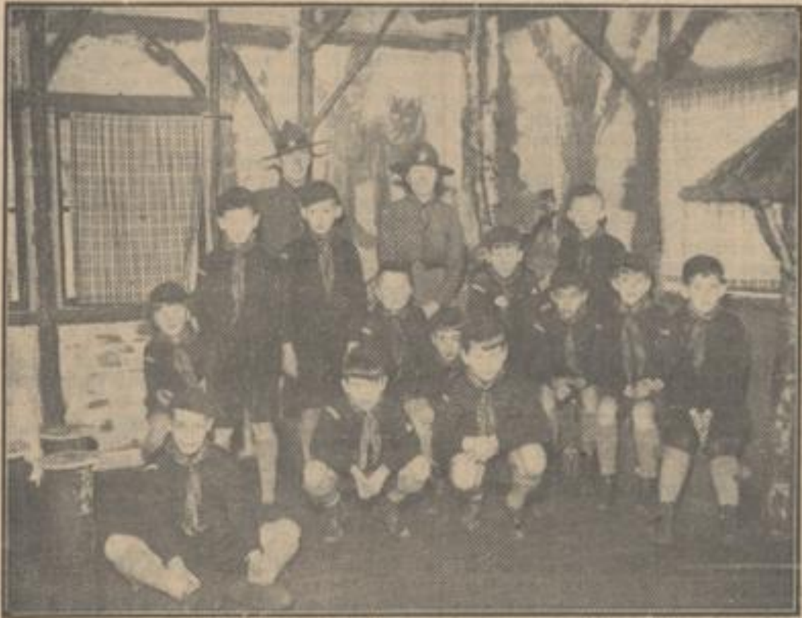
Zaterdag j.l. werd de nieuwe bijbouw van het troepenhuis van de Veluwsche Verkenners , afd. Arnhem, aan den Apeldoornschenweg en bestemd voor de Welpen, officieel geopend. De Welpen in hun nieuw verblijf.