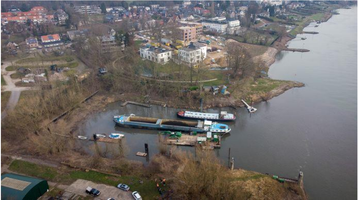
Het uitbaggeren van de Arnhemse defensiehaven vanuit de lucht gezien. Ten noorden van de haven is Landgoed Klingelbeek te zien.