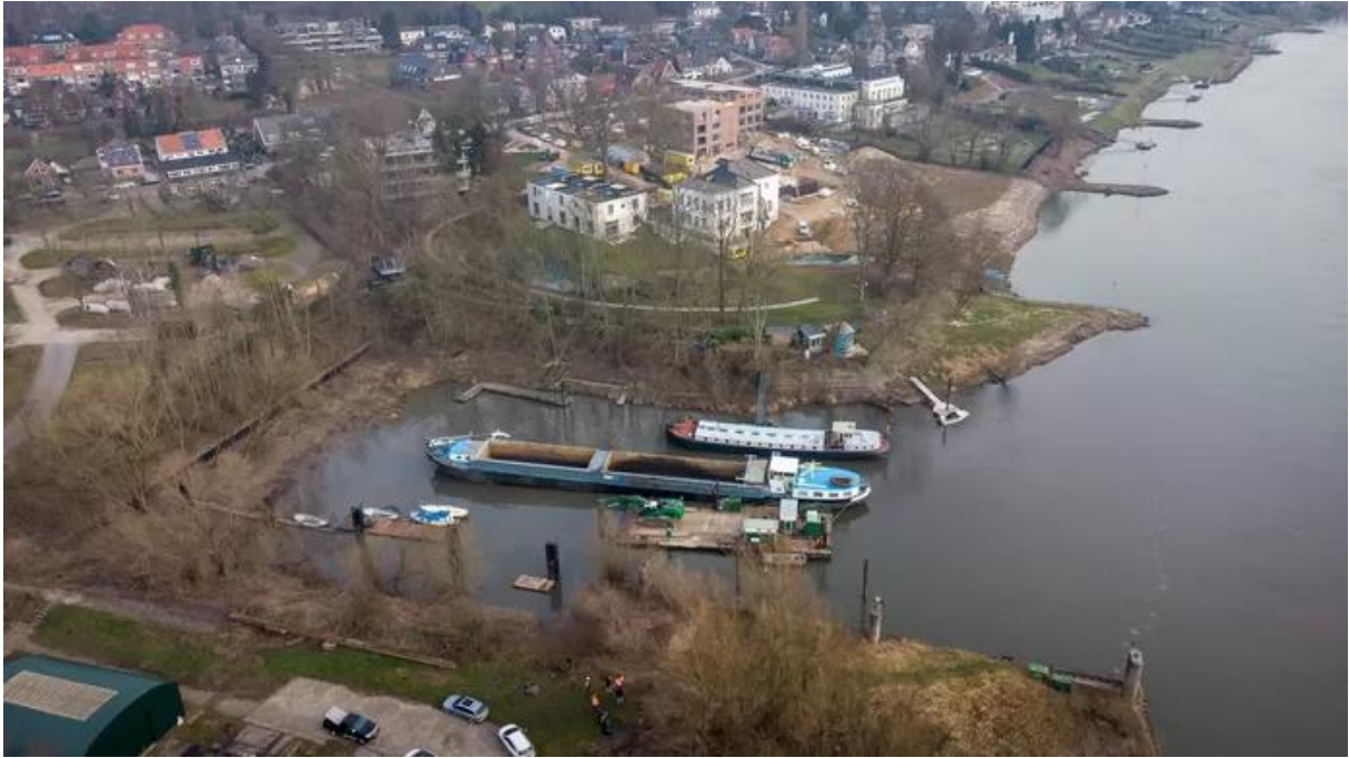
De Arnhemse defensiehaven vanuit de lucht gezien. De haven wordt de komende zes weken uitgebaggerd door de gemeente.